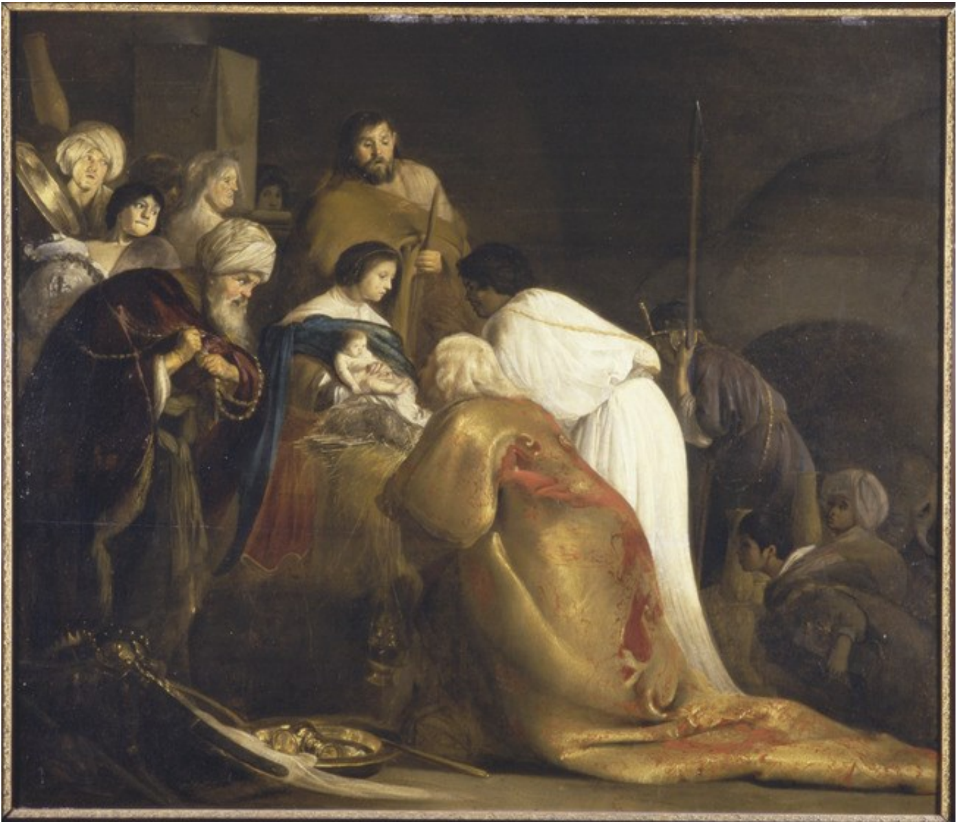
De aanbidding door de drie wijzen 1634, olieverf op paneel, 79 x 92,3 cm. Amersfoort (NL), Flehite museum

• ca.1601 Amersfoort - † 10-08-1669 Amsterdam