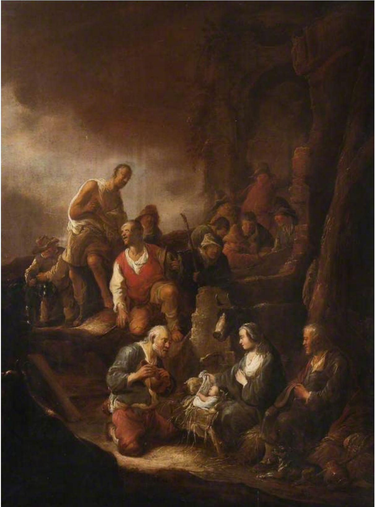
De aanbidding door de herders Olie op canvas, 109 x 82 cm. Kilmarnock (Scotland), The Dick Institute