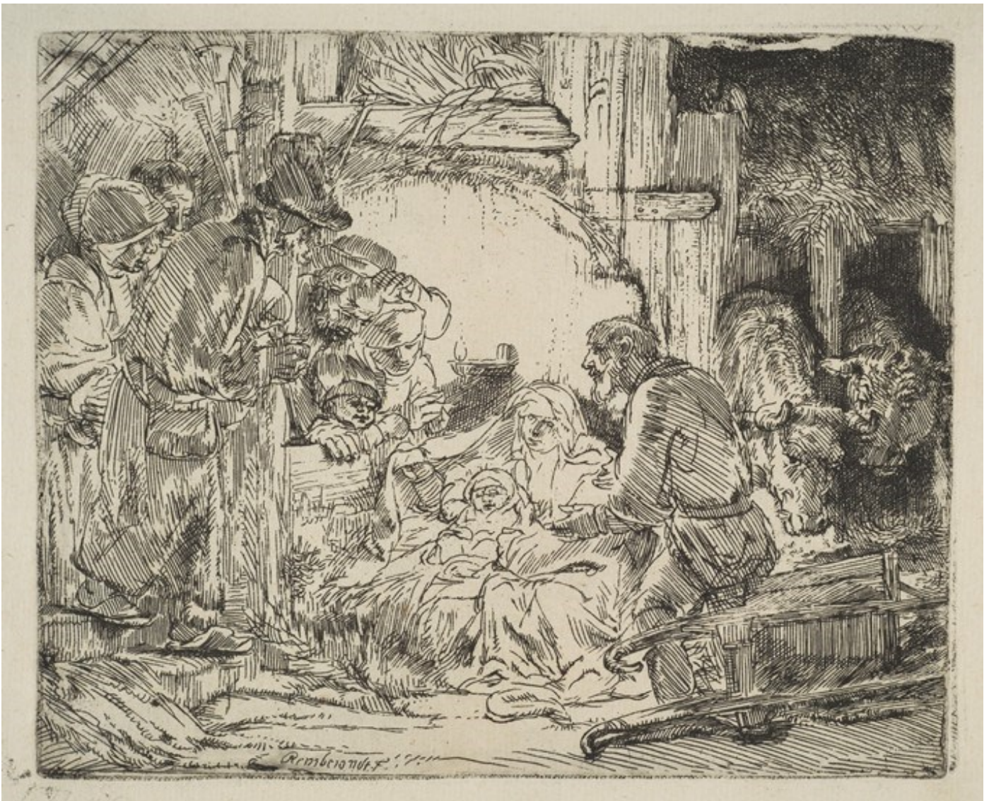
Aanbidding door de herders met olielamp ca. 1654, ets gedrukt op Chinees papier, 10,5 x 12,9 cm. Amsterdam (NL), Rijksmuseum

Rijn Rembrandt van Kunstschilder, etscher en tekenaar • 15-07-1606 Leiden - † 04-10-1669 Amsterdam