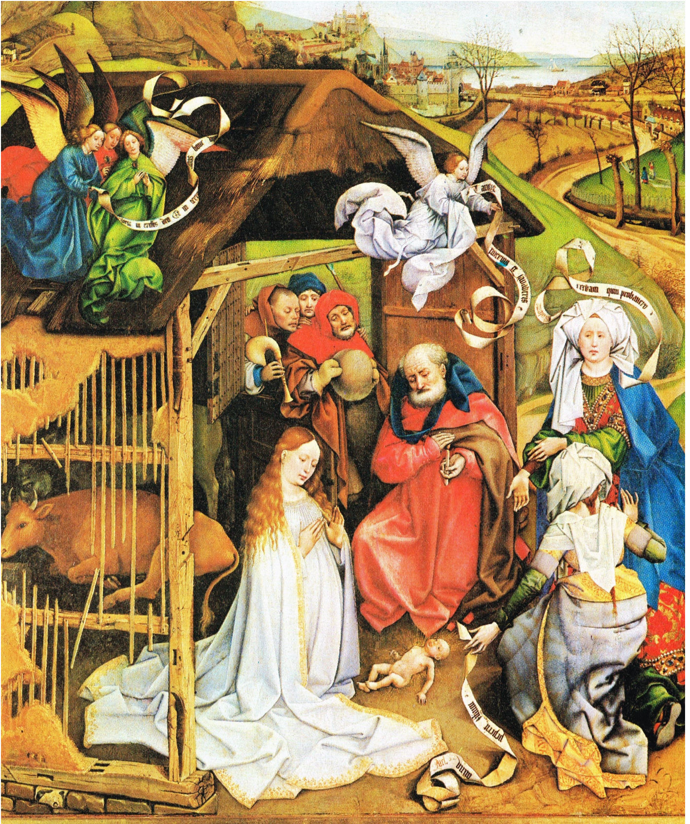
De geboorte van Christus 1425, tempera op hout, 87 x 70 cm. Dijon (F), Musée des Beaux-Arts

Campin Robert Zuid-Nederlandse kunstschilder •1375 (?) Doornik (?) - † 26-04-1444 Doornik