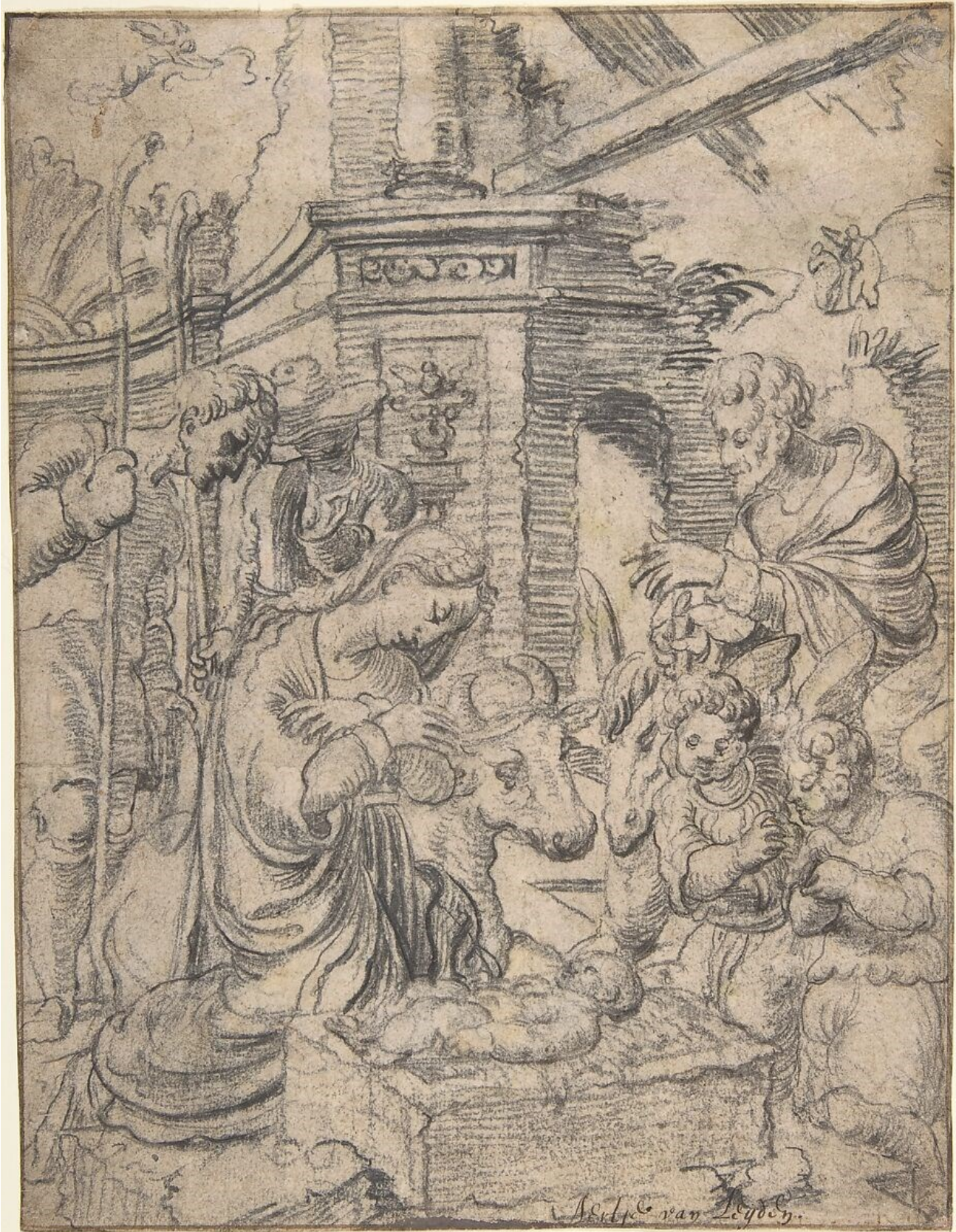
Aanbidding herders ca.1527, pentekening op lichtbruin papier, 24,8 x 19,1 cm. New York (USA), Metropolitan Museum

Leyden Aertgen (Allaert) Claesoon van Kunstschilder, tekenaar, ontwerper glas in lood • ca. 1498 Leiden - † ca. 1564 Leiden