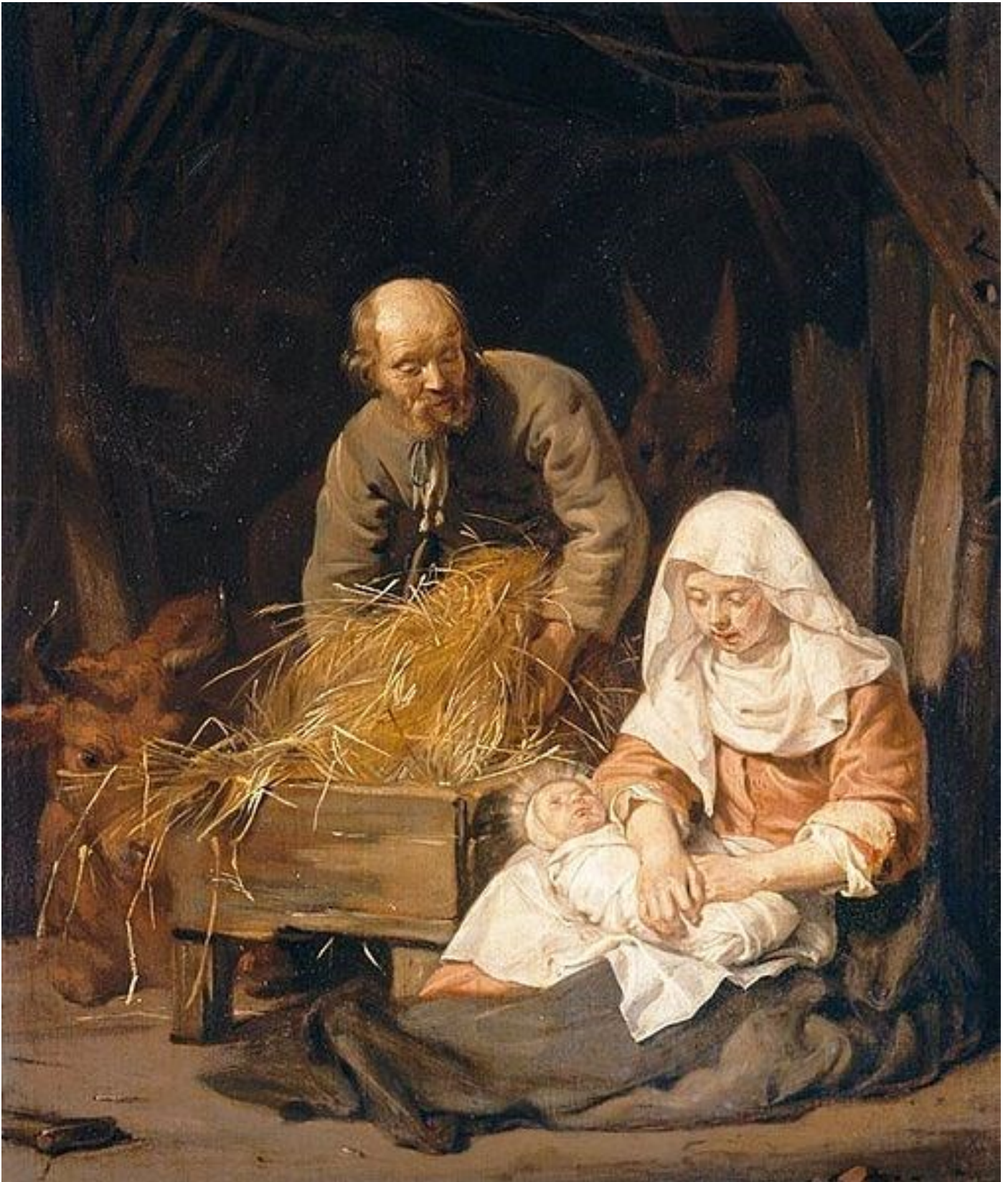
Heilige Familie Olieverf op eikenhout, 41 x 34 cm. Privé collectie