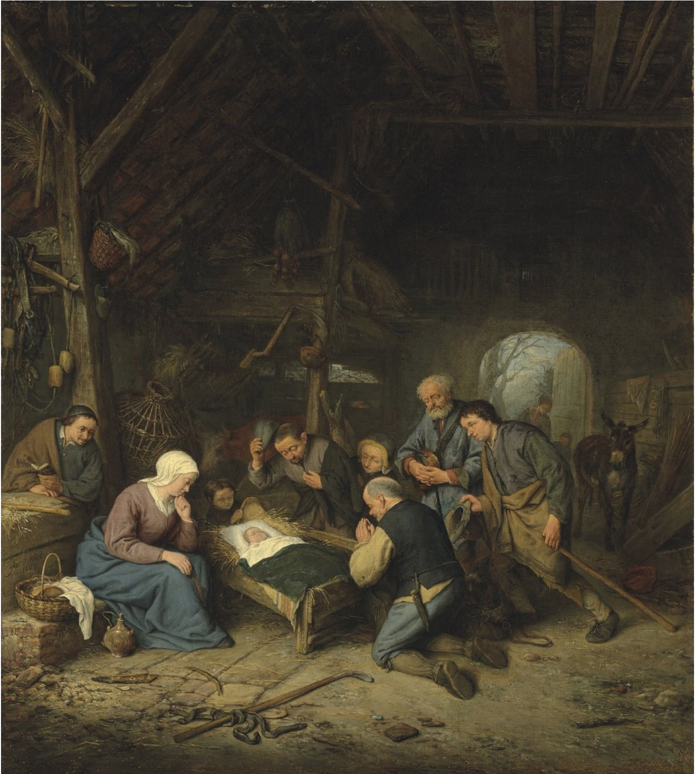
Aanbidding door de herders

• 10-12-1610 Haarlem - † 27-04-1685 Haarlem