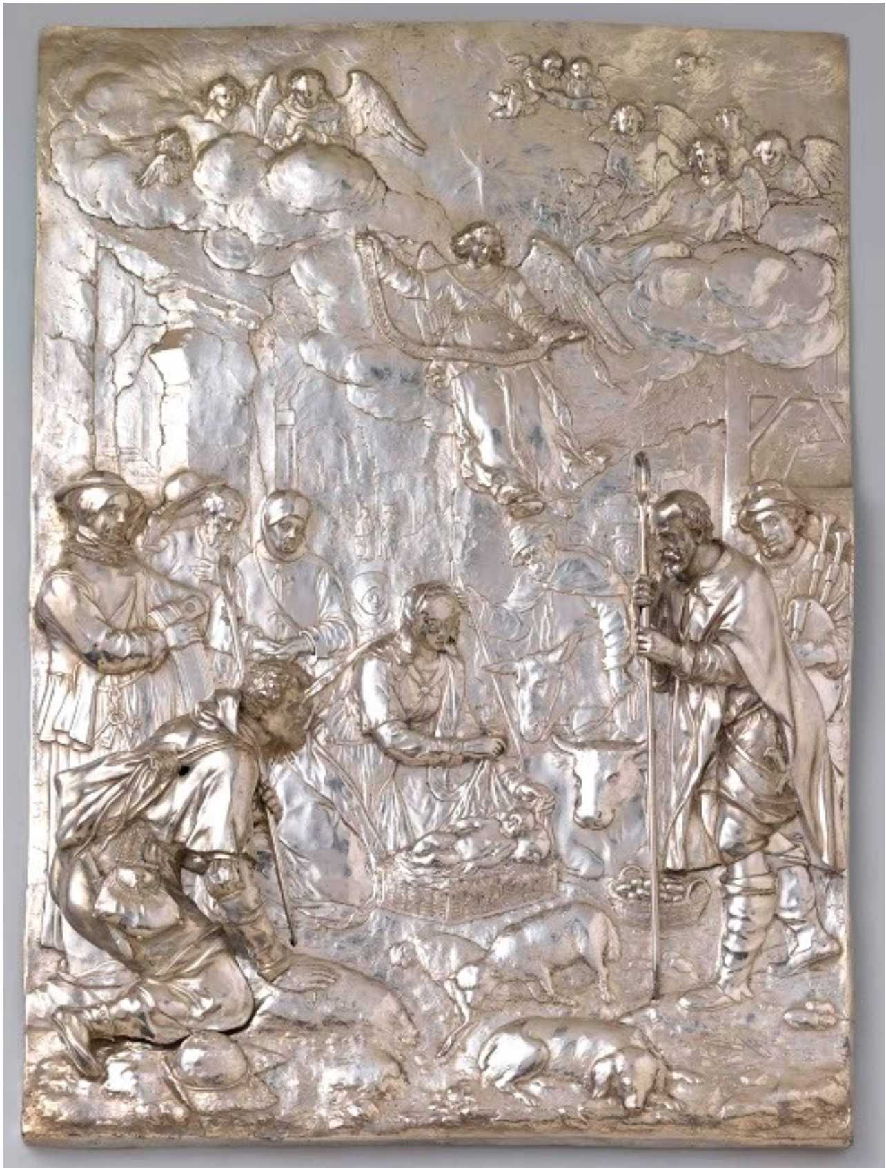
Aanbidding van de herders 1607, zilver, 31,9 x 22,7 cm. Amsterdam (NL), Rijksmuseum