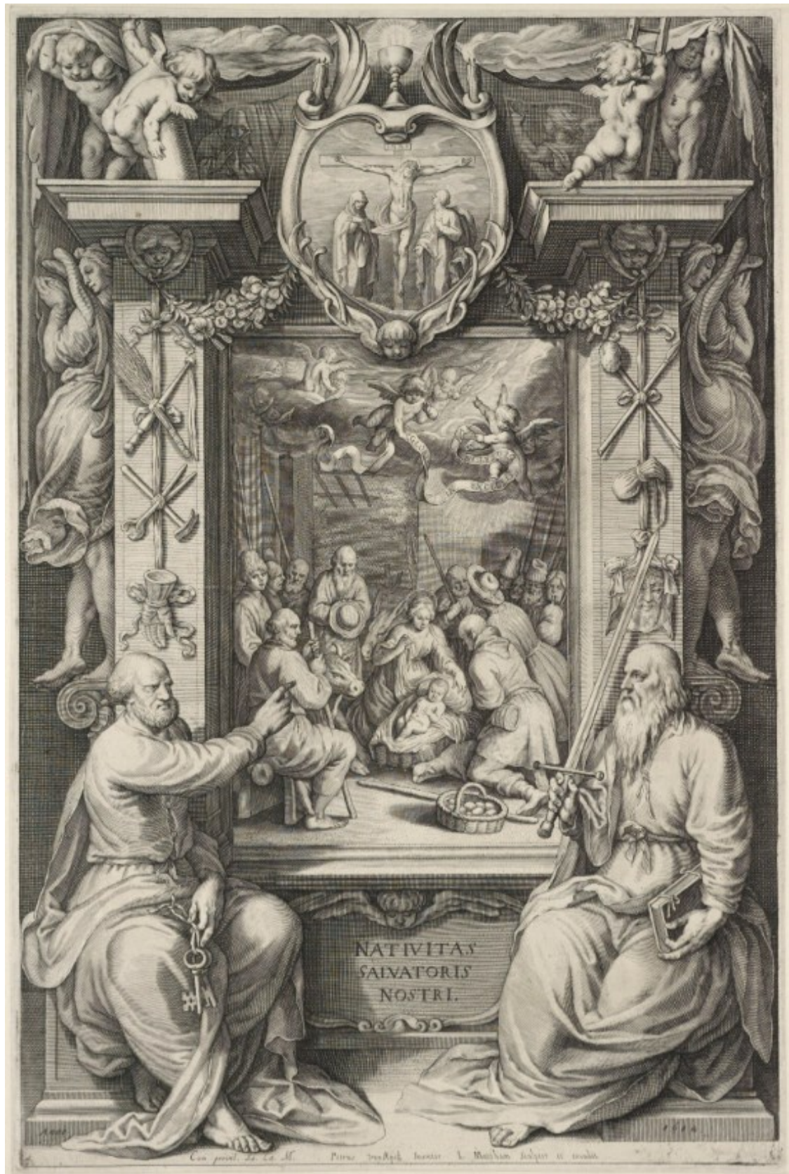
Aanbidding door de herders met Petrus en Paulus Gravure 443 x 292 mm Rotterdam (NL) Booijmans van Beuningen