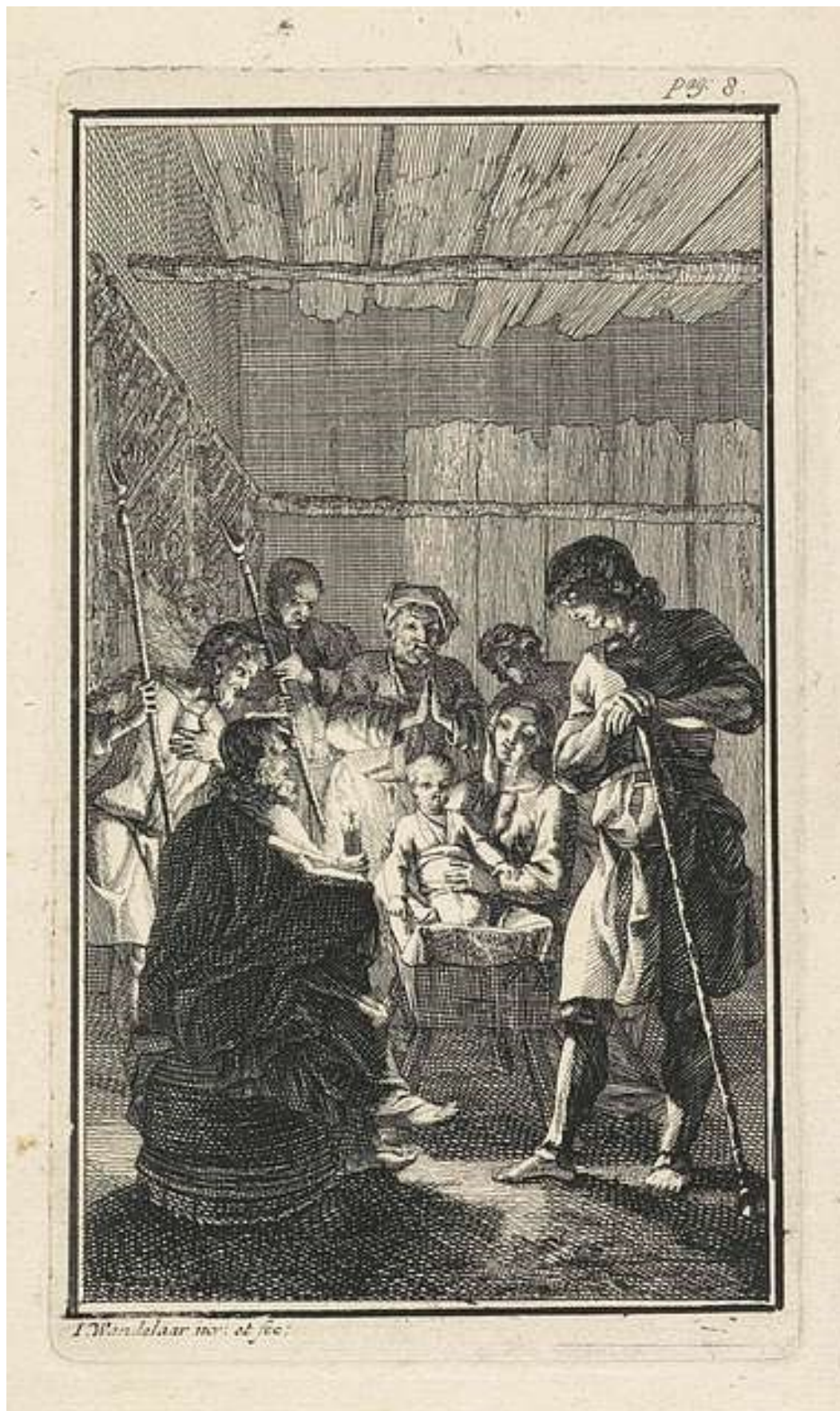
Aanbidding van de herders

• 14-04-1690 Amsterdam - † 26-03-1759 Leiden