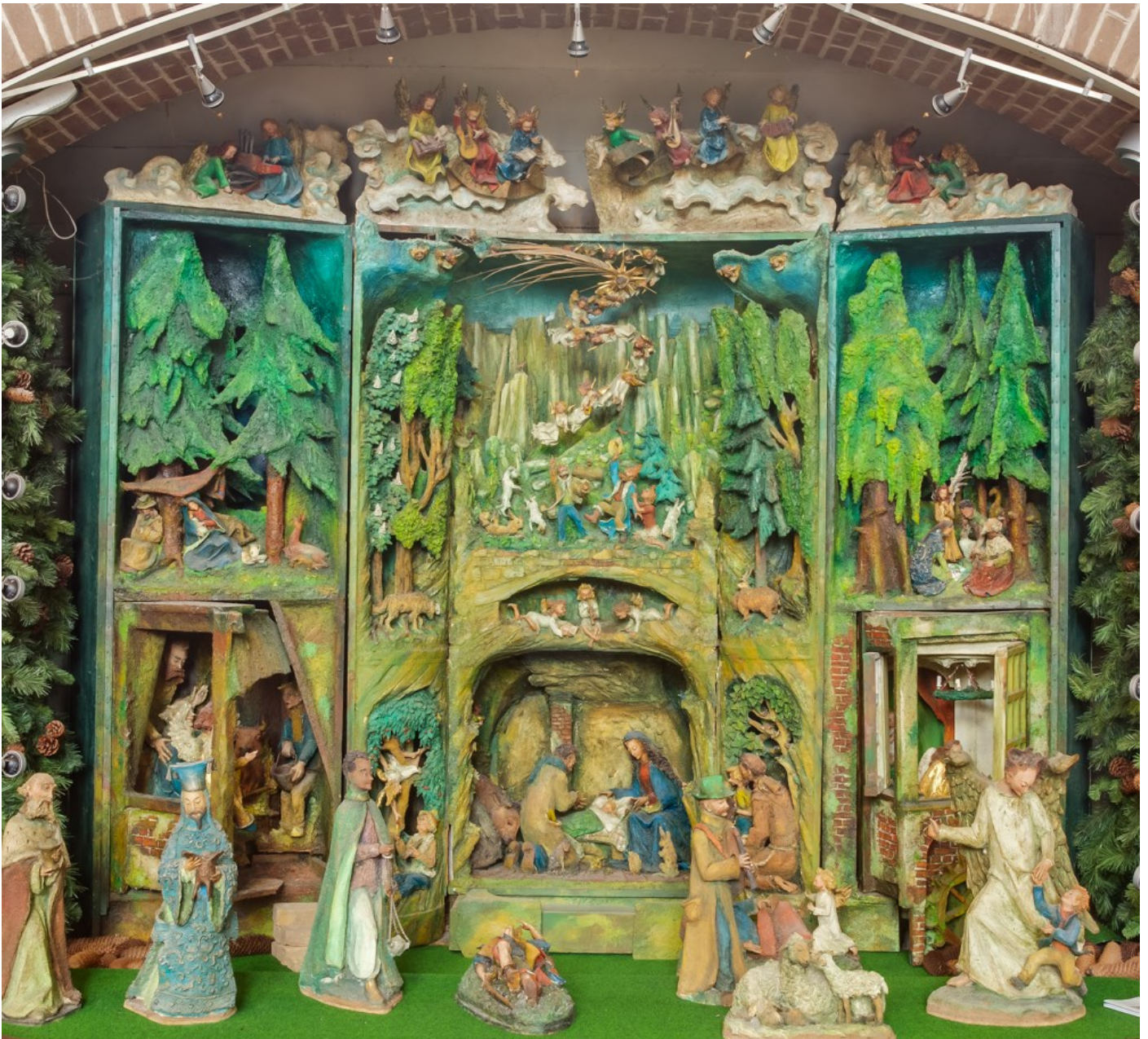
Kerstvoorstelling 1975-1979, Chamotte, verf en hout, 200 x 200 cm. Voorhout (NL), H. Barthlomeuskerk