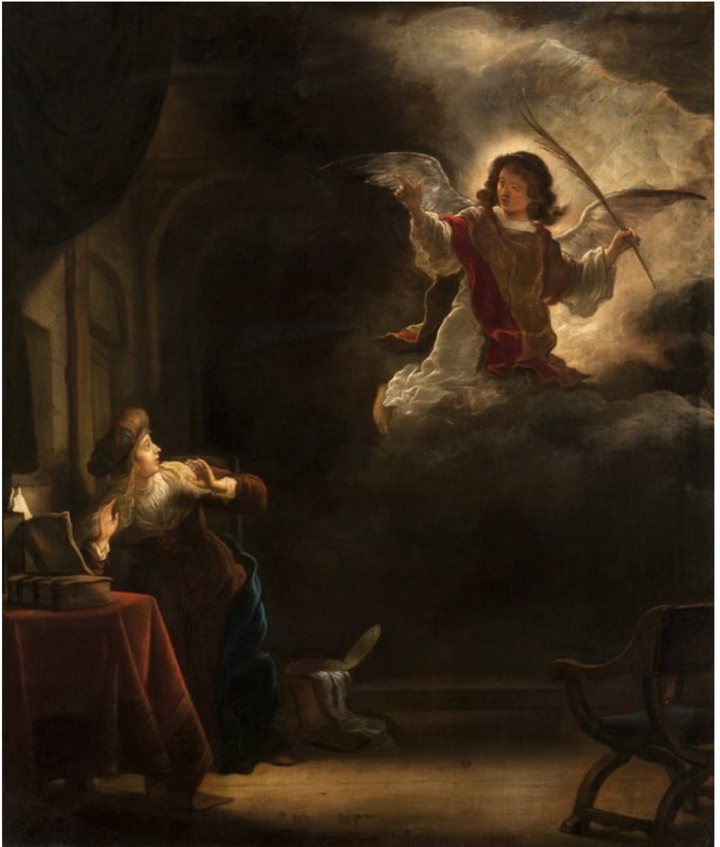
Annunciatie ca. 1655, olieverf 61,5 x 72,5 cm. Stockholm (SE), Hallwyl Museum

Koninck Salomon Kunstschilder en graveur • 1606 Amsterdam - † 08-08-1656