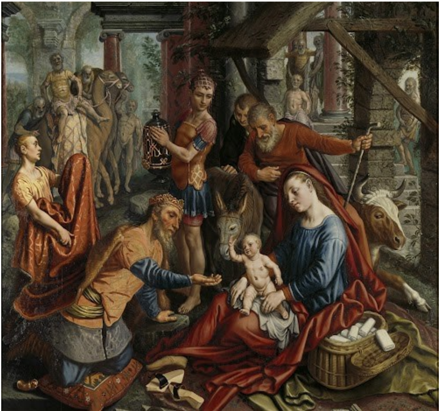
Aanbidding van de koningen 1560, olieverf op paneel, 167,5 x 180 cm. Amsterdam (NL), Rijksmuseum

• ca.1508 Amsterdam - † ca.1575 Amsterdam